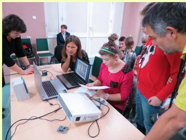
Vidéoconférence avec le collège polonais de Bialowesa.

Des échanges avec des établissements étrangers seront recherchés. Des contacts existent avec la Pologne, la Chine et l'Amérique du Nord. Les élèves pourraient ainsi croiser les approches et les représentations.