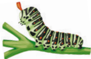
Chenille de Machaon. Illustration : Nicolas Virgnaud

Rens. et inscription au 05 49 02 33 47 ou contact@reserve-pinail.org