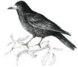
Chebeu freux. Illustration : Ivan Escardié

Partez à la découverte de l'univers méconnu des Lichens, ces champignons mystérieux qui intriguent de par leur fonctionnement symbiotique, la particularité de leurs formes et leur utilité en tant que bio-indicateurs. Lieu de R.-V. donné sur inscription. Gratuit. Tous publics. Rens. et inscription obligatoire sur www.vienne-nature.fr ou au 05 49 88 99 04.