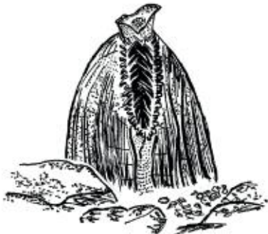
Mulette épaissée. Illustration : William Bécuchaud

Lieu de R.-V. donné sur inscription. Gratuit. Tous publics. Prévoyez bottes ou chaussures de randonnée et vêtements adaptés à la météo. Rens. et inscription obligatoire sur www.vienne-nature.fr ou au 05 49 88 99 04.