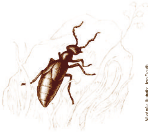
Mélèze mâle. Illustration : Ivan Escudé

Vienne Nature vous propose de sillonner les sentiers du site classé d'Angles-sur-l'Anglin à la découverte de ses paysages remarquables. Les découvertes se feront au fur et à mesure de notre déambulation ! Sortie organisée dans le cadre de la politique européenne Natura 2000 , R.-V. à 14h sur le parking du château. Gratuit. Tous publics. Rens. et inscription sur www.vienne-nature.fr ou au 05 49 88 99 04.