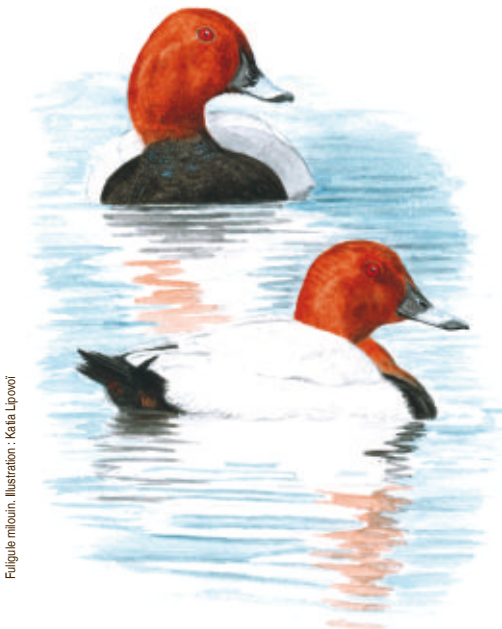
Fuligule mbourin. Illustration : Kasia Lipowat

Apportez une lampe frontale si vous en avez. Rens. et inscription obligatoire sur www.vienne-nature.fr ou au 05 49 88 99 04.