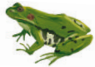
Grenouille verte. Illustration : Nicolas Virenaud