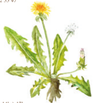
Pissenit. Illustration : Jacqueline Pastureau