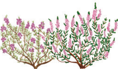
Callune et Brojère cendrée. Illustration : Nicolas Vignaud

Rens. et inscription obligatoire au 05 49 85 11 66.