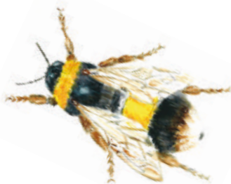
Bourdon. Illustration : Jacqueline Pastureau

Gratuit. Tous publics. Rens. au 05 49 88 55 22.