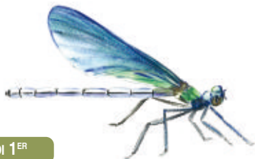
Demioiselle - Illustration : Jacqueline Pastureau