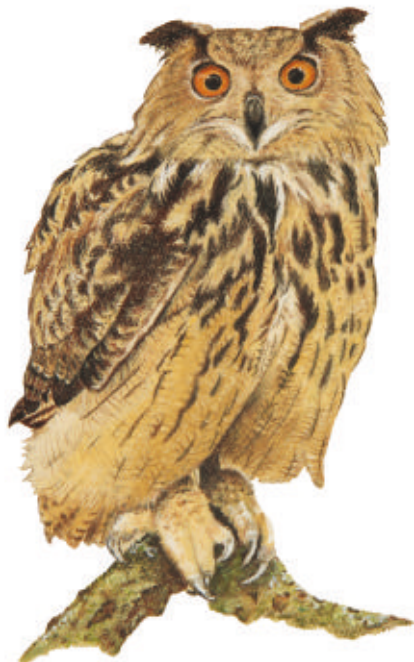
Hibou grand-duc. Illustration : Christine Stouvestre

La date et le lieu précis des animations seront disponibles à partir du 15 février. Pour réserver vos porte-greffes ou vos greffons, contactez Prom'Haies au 05 49 07 64 02.