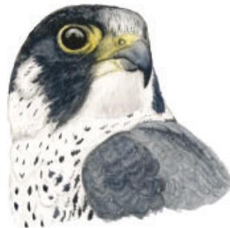
Faucon pèlerin. Illustration : Katia Lipovoi

R.-V sur le parking de la réserve naturelle du Pinail. Sortie gratuite. Chaussures de randonnée et chapeau recommandés. Interdit aux vélos et aux chiens (même tenus en laisse). Accessible aux personnes à mobilité réduite accompagnées de deux adultes (prêt de joëlettes). Rens. et inscription au 05 49 02 33 47 ou contact@reserve-pinail.org