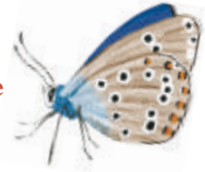
Azaré commun. Illustration : Nicolas Vignaud