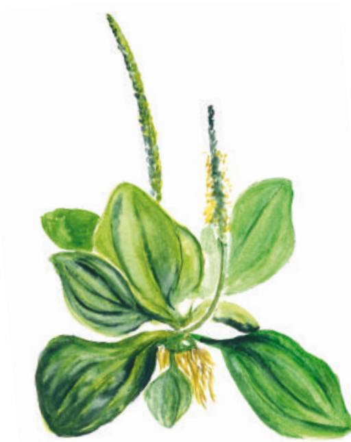
Plantain. Illustration : Jacqueline Pastureau