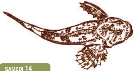
Crabot commun. Illustration : William Bédouchaud

R.-V. sur le parking de Super U, D727, pour covoiter. Gratuit. Tous publics. Rens. au 06 60 43 37 03.