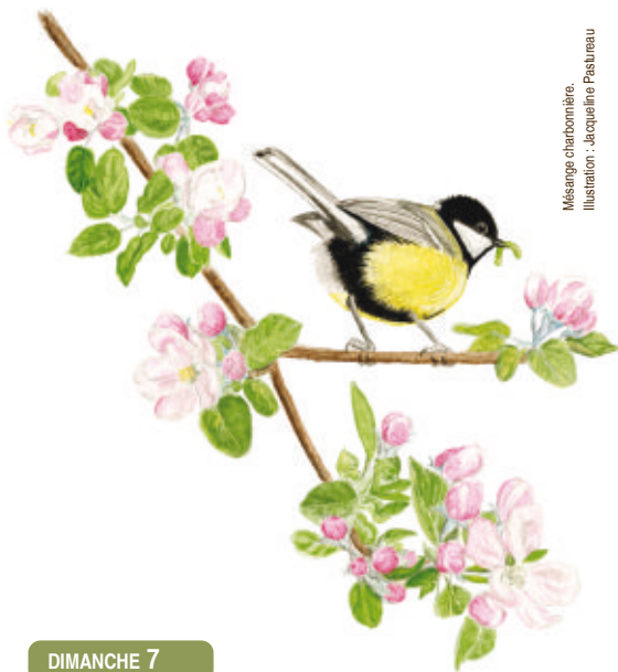
Mésange charbonnière. Illustration : Jacqueline Pastureau

R.-V. au Parcobus de Champlain. Prévoir bottes et lampe torche. Gratuit. Réservé aux adhérents. Rens. et inscription obligatoire sur www.vienne-nature.fr ou au 05 49 88 99 04