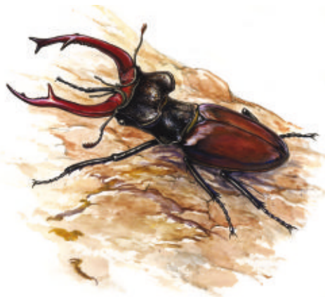
Lucane cerf-volant. Illustration : Ivan Escudré